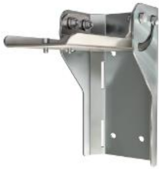
Кронштейн регулируемый консольный KPK F2