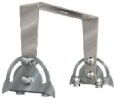
Кронштейн регулируемый П-образный КРП