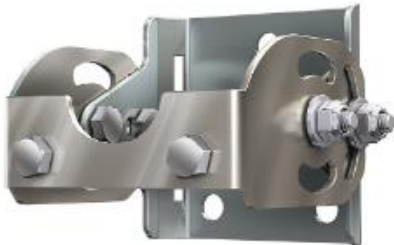
Кронштейн регулируемый консольный KPK LC F2