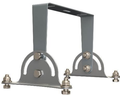
Кронштейн регулируемый П-образный КРП SM