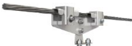
Кронштейн тросовый регулируемый КТР